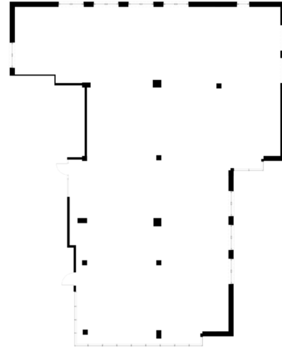
Piętro 1 1st Floor

Combined locals X3.1 and X3.2 located on the first floor of Building X, the largest building i Zawita 65 Business Park. Purpose: office space or service activities.